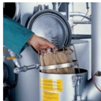
Garze filtro e prendispilli – il design arrotondato impedisce l'accumulo di detriti negli angoli