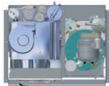
Crossline: qui il distillatore è sistemato lateralmente