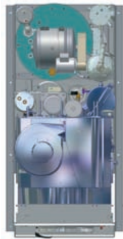
Slimline: il distillatore è collocato dietro alla macchina

Sviluppando la P12, P15 e P18 ci siamo focalizzati soprattutto su una questione: la mancanza di spazio nelle lavanderie. Per questo motivo le macchine sono disponibili in due varianti: Slimline e Crossline, strutturate per adattarsi alle esigenze del Vostro negozio, con una altezza d'entrata ora inferiore ai 2.000 mm.