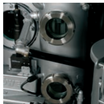
Il nuovo, separatore acqua unico BÖWE