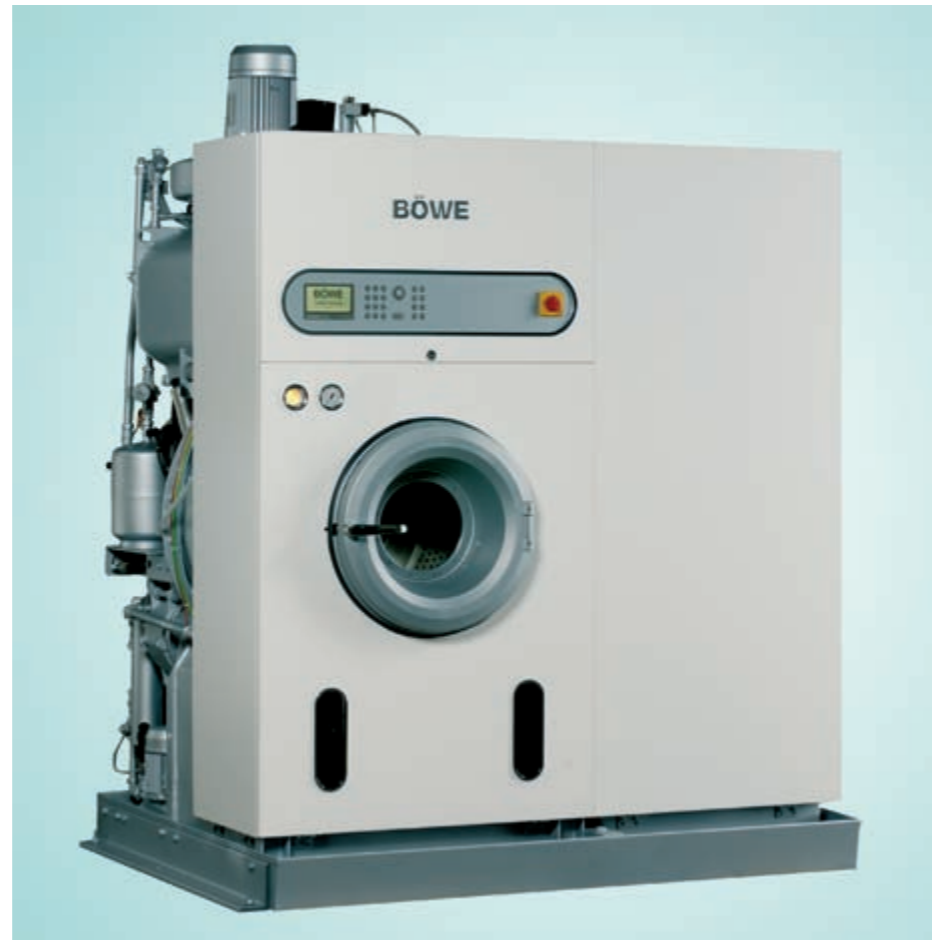
Design classico ed elegante per il vostro negozio