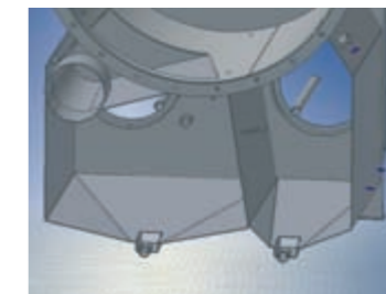
Nessun deposito - autopulente

Con la moderna tecnica per superfici piane, i tre serbatoi praticamente non consentono depositi.