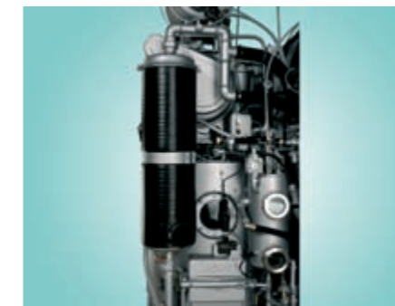
SLIMSORBA PL è conforme ai più severi regolamenti ambientali

L'unità di assorbimento SLIMSORBA completamente integrata offre la possibilità di avere indumenti privi di odore ed una concentrazione residua di solvente eccezionalmente bassa.