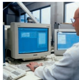
Con la connessione diretta Böwe è possibile una manutenzione a distanza