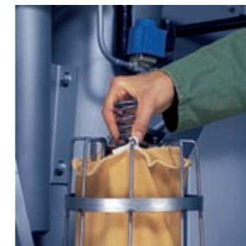
Da pulire solo una volta al giorno: il filtro garza principale

Gli intervalli di pulizia per i filtri sono insolitamente estesi grazie a speciali "filtri residui", uno principale particolarmente grande ed uno secondario. I tre serbatoi acqua sono autopulenti. In opzione le macchine sono anche disponibili con un secondo filtro.