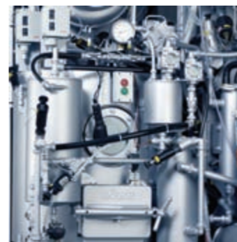
Distillo frazionato ad alta efficienza

MultiSolvent® - con Capacità di Carico a Partire da 12 kg