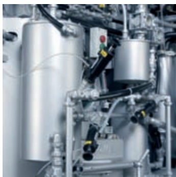
Evita la formazione degli odori: separatore d'acqua automatico

Con le macchine BÖWE MultiSolvent® si può essere sicuri della più alta qualità. Speciali processi tecnologici perfezionati garantiscono macchine con un'ottima adattabilità a tutti i relativi solventi.