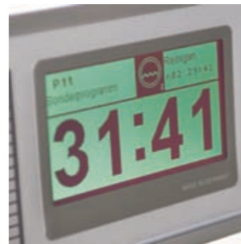
Facilmente visibile a distanza: il grande display indica il tempo rimanente dei cicli